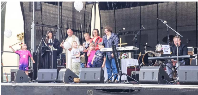
Der Gottesdienst zum Stadtfest

MÜCHELN. „Gott macht die Sache rund“ – unter diesem Motto trafen sich mehr Menschen als sonst auf dem