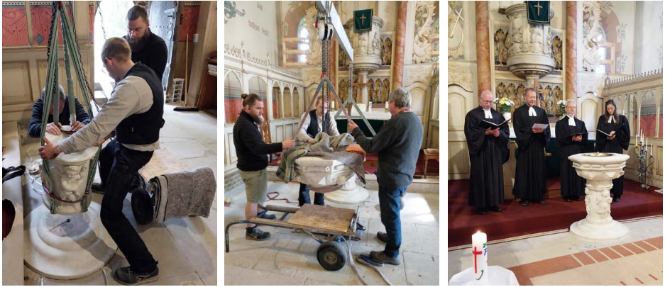
Der Sockel des Taufsteins wurde mittels Seilzug auf den Fuß gesetzt, dann folgte das Taufbecken. Zum Festgottesdienst erstrahlte der Taufstein in neuem Glanz.

NIEDEREICHSTÄDT. Der Taufstein bestehend aus Fuß, Sockel und Taufbecken ist nach fast einjähriger Restaurierung in die Kirche St. Wenzel Niedereichstädt zurückgekehrt.