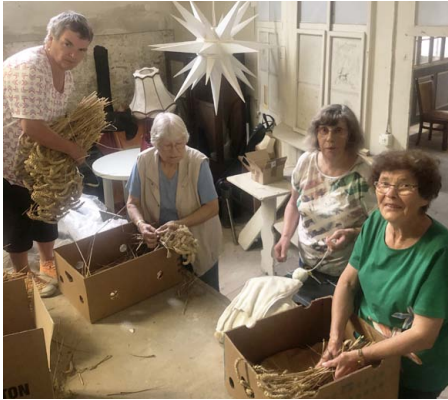
Die Frauen lagern das Getreide ein.