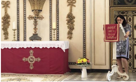
Schulleiterin Manuela Kuhl in der Kirche St. Ulrich

ST. ULRICH. Wohl zum ersten Mal in der Geschichte wurden die Abiturzeugnisse des Mücheln Gymnasiums in