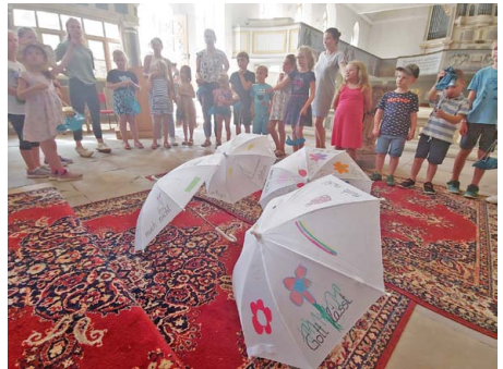
Gott beschützt/beschirmt uns.