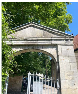
Friedhof St. Ulrich

ST. ULRICH. Vielen Dank für die Metallabdeckung unseres frisch restaurierten Eingangsportals am Friedhof St. Ulrich.