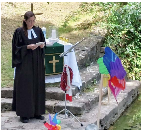
Taufe zum Johannisfest

In diesem Jahr ging es beim Johannisfest an der Geiselquelle darum, dass man sein Fähnlein beziehungsweise sein Windrad nicht immer nach dem Winde drehen sollte. Doch wenn man sein Leben nach dem Wind Gottes, nach seinem Geist ausrichtet, wird es niemals Stillstand, sondern immer Leben geben. Im nächsten Jahr findet das Johannisfest am 21. Juni um 14.00 Uhr statt – Taufen können ab sofort angemeldet werden.