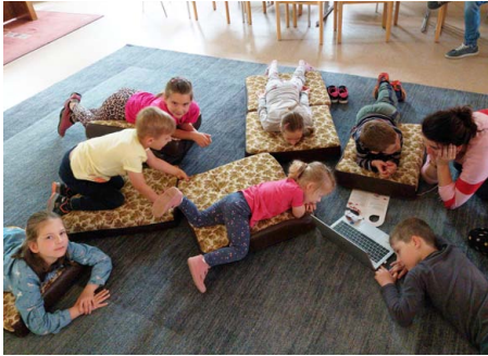
Wir lauschten einem biblischen Hörspiel.