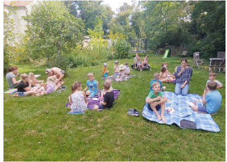
Picknick im Pfarrgarten